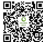
奥佳华官方微信二维码